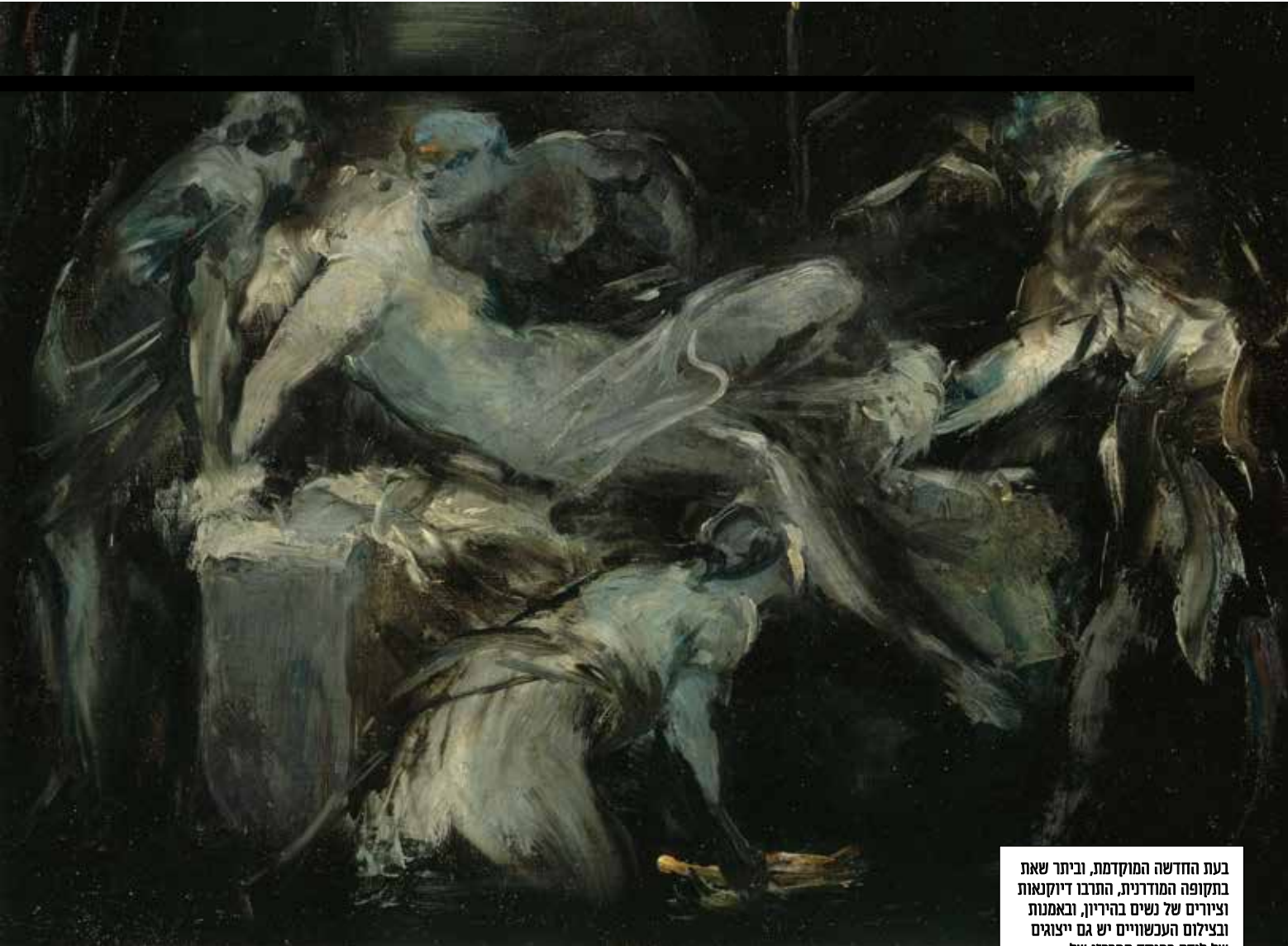
בעת החדשה המוקדמת, וביתר שאת בתקופה המודרנית, התרבו דיוקנאות וציורים של נשים בהיריון, ובאמנות ובצילום העכשוויים יש גם ייצוגים של לידה כמוקד המרכזי של ההתרחשות. סצנת לידה, ז'אן-בטיסט קארפו, 1870 לערך המוזאון לאמנויות יפות של פריז

המקשה לילד מחוג קהל חסידים בית אל, הספרייה הלאומית, 8°16' ע"ב).