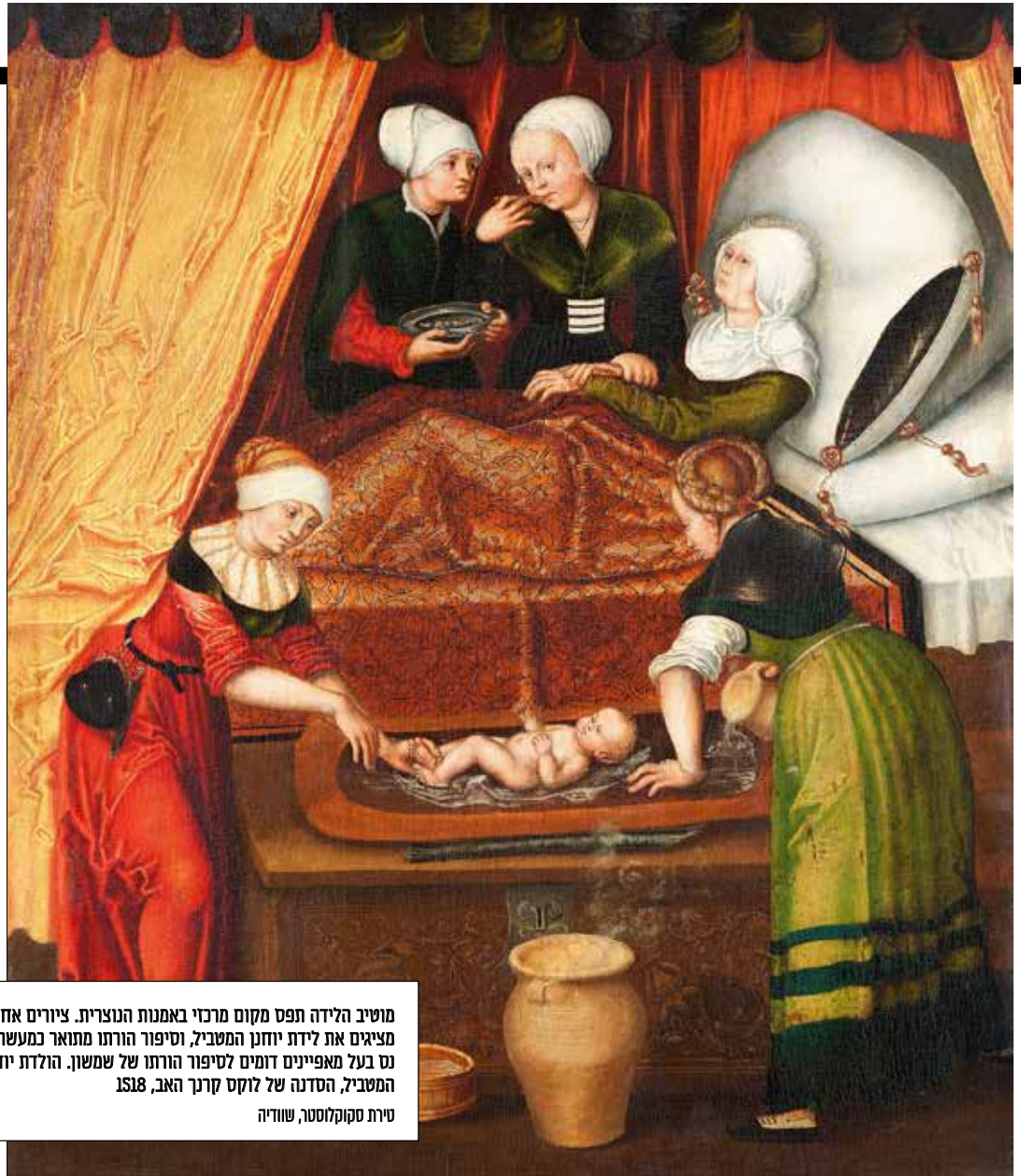
מוטיב הלידה תפס מקום מרכזי באמנות הנוצרית. ציורים אחדים מציגים את לידת יוחנן המטביל, וסיפור הורתו מתואר כמעשה נט בעל מאפיינים דומים לסיפור הורתו של שמשון. הולדת יוחנן המטביל, הסדנה של לוקס קרנר האב, 1518 טירת סקוקולסטור, שוודיה