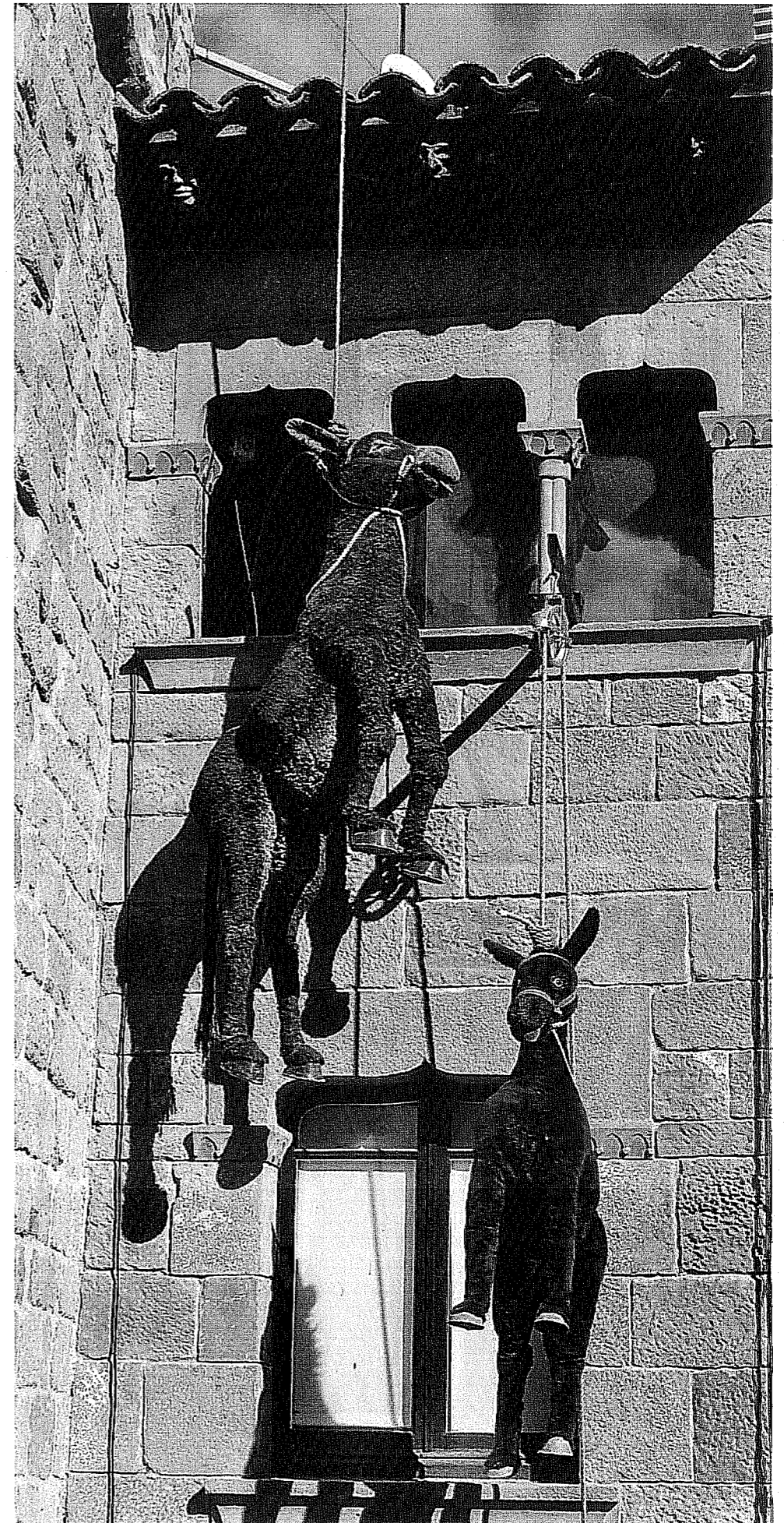
בובות חמורים בפסטיבל סולסונה בספרד. בנבואה של האנושיות

אבל רגע, האומנם בכל מקום ובכל תקופה? אתוננו של בלעם, למשל, היתה חכמה יותר מאדוניה ומיטיבה ראות ממנו, וחז"ל אפילו מונים את "פי האתון" עם עשרה דברים שנבראו בערב שבת בין השמשות. על פי הנבואה בספר זכריה ט, יהיה המשיח "עני ורכב על-חמור ועל-עיר בן-אתנות"; ומחברי הכרית החדשה, מצד, שהקפידו מאוד לשפץ את קורות חייו של ישו כך שיתאימו לנ-