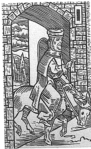
המשיח על חמור, מתוך הגדת פראג

החמור ומי ילך ברגל. וכל אלה, כמוכב, אינם אלא קצה הקרחון: 39 פרקים קצרים לספר, וכל אחד מהם נאחז בזנבו האפרפר של חמור מיתני או סמלי אחר, ומגדל סה להתחקות אחר מקורותיו בע"פילי העבר ואחר גלגוליו השונים לאורך ההיסטוריה. מתברר הספר הם מעייני בלתי גדלה של ידע ושל אנקדוטות צבעוניות מכל סוג ומין, ובין טורי הטקסט שלובים גם שירים – חלקם נהדרים – וציטוטים ארוכים מתוך חיבורים היסטוריים כאלה ואחרים. כך נוכל למצוא כאן את השיר "על ספרים Stultifera navis" ("ספינת השוטים") מאת סבסטיאן ברנדט (1494) בתור גום קולח של עמיננדב דיקמן; או את המשל על "החמור" ושלוש בתרגום עברי מליצי שראה אור ב-1827 ב"ביכורי העיתים", כתב עת בעברית של משכילי אוסטריה וגליציה.